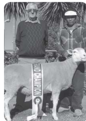
Denvor IDF Stud