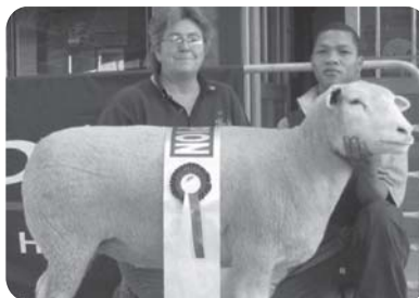
ME Bergh - Lank-ge-wag Stoet